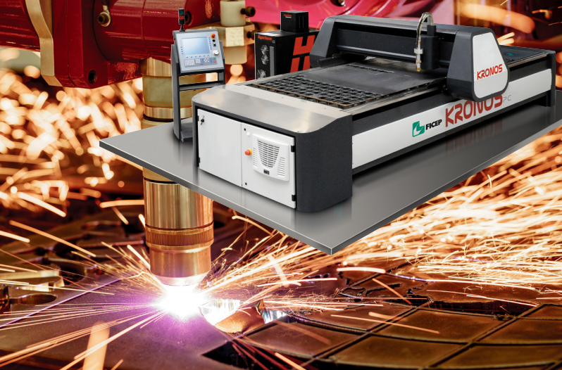
TABLE DE DÉCOUPE PLASMA

Cette table de découpe plasma nous permet de réaliser la découpe sur mesure de vos platines ou goussets à partir de tôles en acier, aluminium ou inox en forte épaisseur (jusqu'à 30 mm).